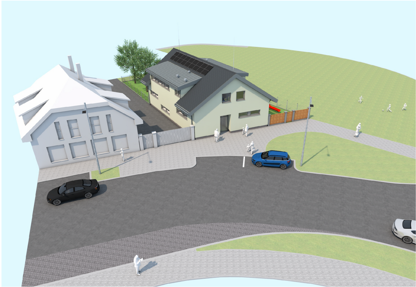
POHLED OD ZÁPADU