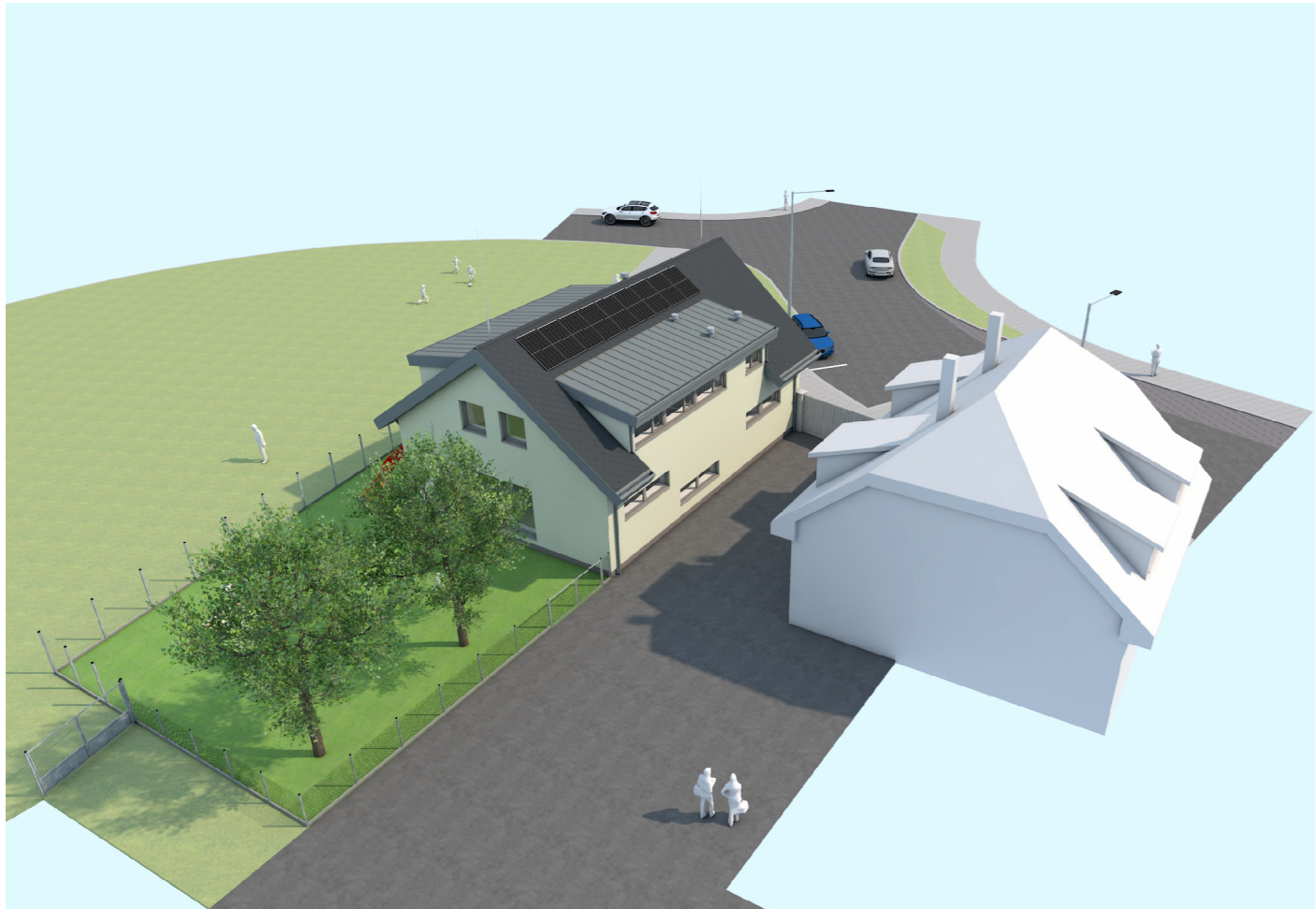
POHLED OD JIHU